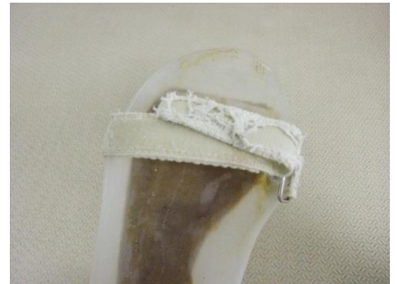
ベルトのほつれ・破損